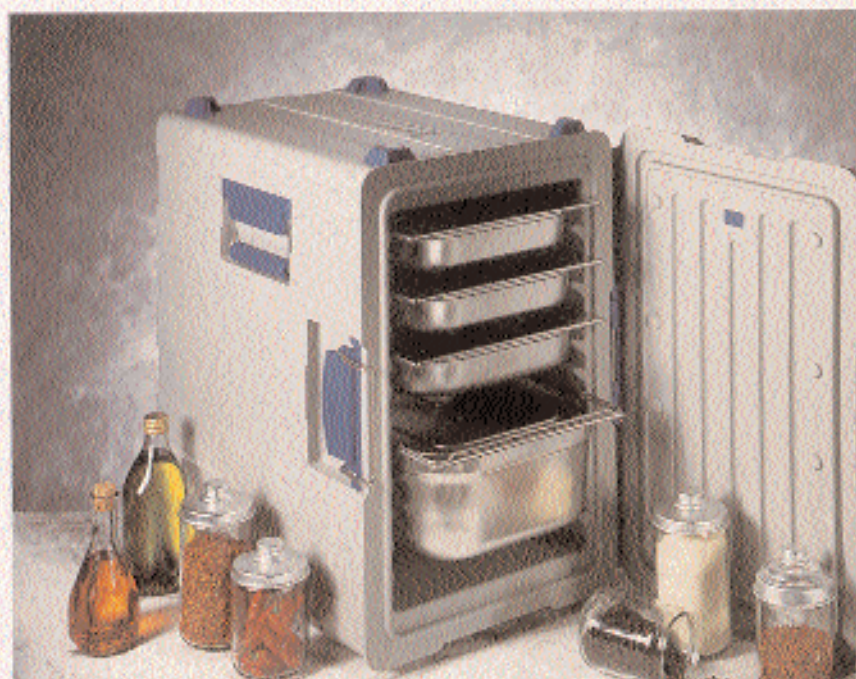
BLANCOTHERM 620 KUF

rieren, ob mit um 270° schwenkbarer und abnehmbarer Flügeltür – wie beim 620 KUF – oder mit selbstfindend steckbarem Universaldeckel – wie beim 620 KUS, KV, KF –, für Ihren Einsatzzweck entdecken Sie im vielfältigen 620er-Profi-Programm auf jeden Fall die passende Lösung.