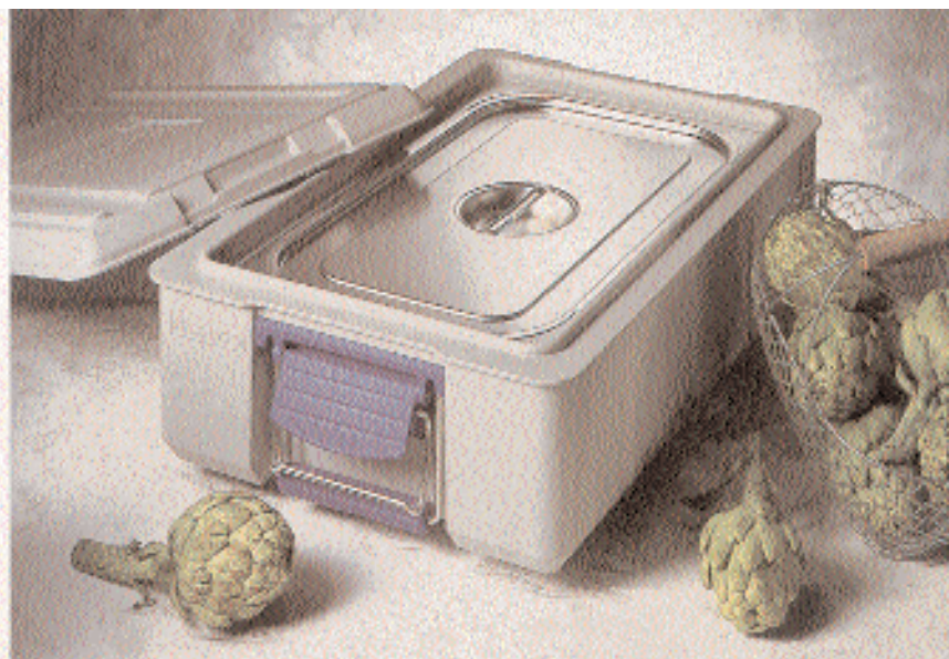
BLANCOTHERM 160 K