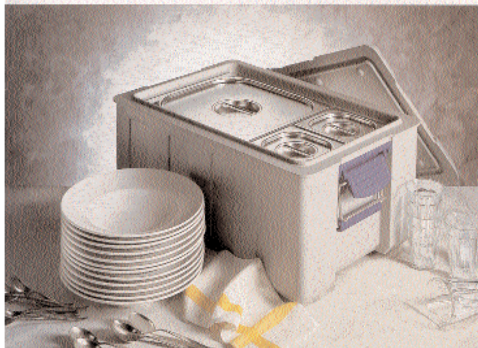
BLANCOTHERM 320 K

Der BLANCOTHERM 160 K ist für eine Bestückung mit GN 1/1, Tiefe 100 mm, vorgesehen, der 320 K für GN 1/1, mit einer Tiefe von 200 mm. Beide Modelle werden als Toplader von oben befüllt.