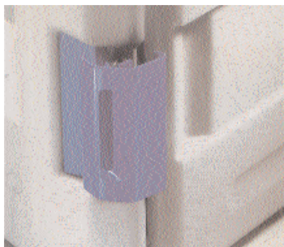
BLANCOTHERM 420 K „quick & easy“-Verschluss