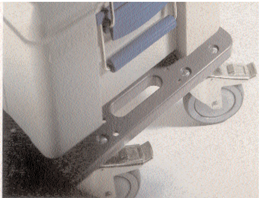
BLANCOTHERM und Rolli