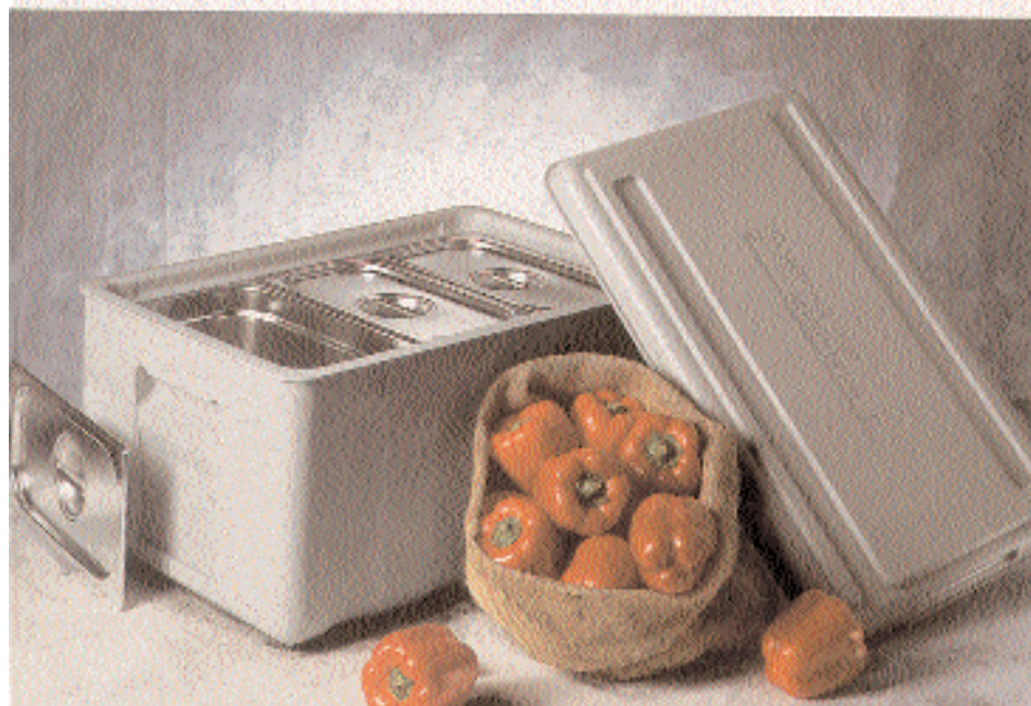
BLANCOTHERM 320 ECO

Kufen und Griffe sind angeformt. Durch umlaufende Vertiefung können auch GN-Behälter mit oben liegenden Griffen eingesetzt werden.