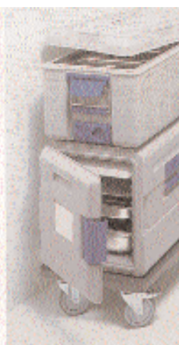
BLANCOTHERM 320 KU, 420 K Mobilstation