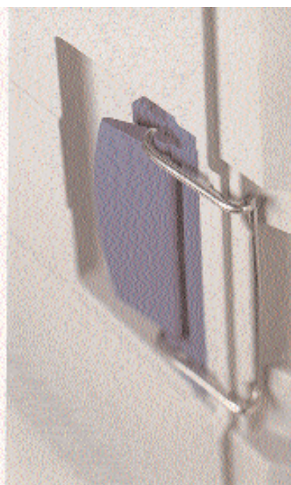
BLANCOTHERM 620 KBS, Steckdeckelverschluss