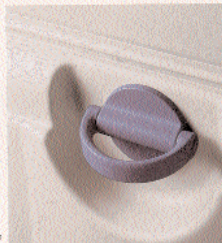
BLANCOTHERM 720 K, Drehverschluss

Mit seinen hervorragenden Isoliereigenschaften und außergewöhnlichen Komfortmerkmalen ist bei diesem Frontlader für den anspruchsvollen Bäcker und Konditor alles bestens in Butter!