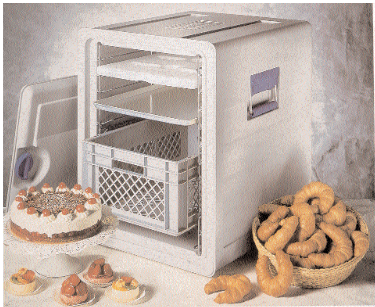
BLANCOTHERM 720 K