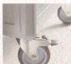
BLANCOTHERM 620 KF fahrbar