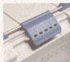
BLANCOTHERM 620 KV Verschluss oben