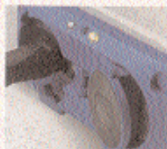
Steckermodule mit Leuchtdioden