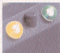
Betriebsanzeige über Leuchtdioden