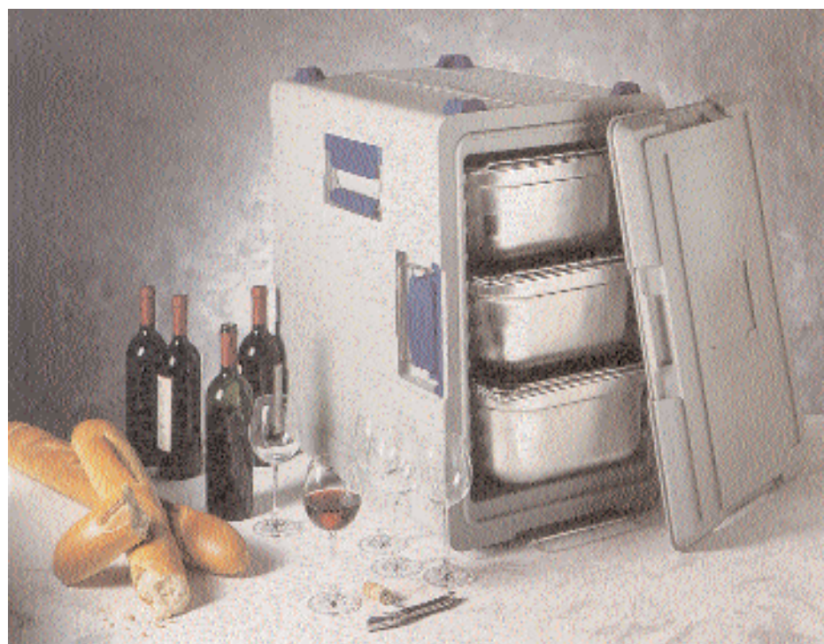
BLANCOTHERM 620 KUS