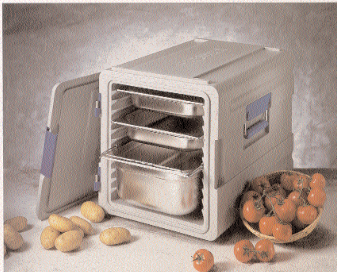
BLANCOTHERM 420 K

Transport-Folli ist er auch ideal als mobile Ausgabestation einzusetzen.