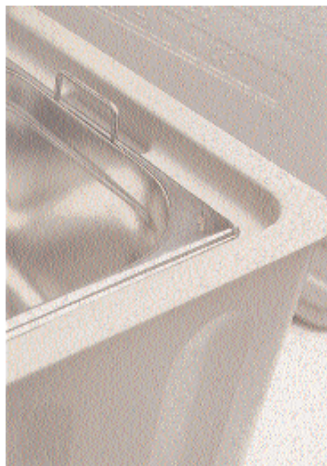
BLANCOTHERM 320 ECO, Gastronombehälter mit Griff oben können eingesetzt werden.